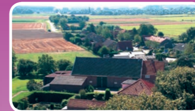
Open voor iedereen